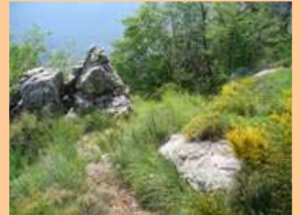
Vue vers le roc d'Orméa. J'entreprends la descente directe vers la Baisse de Scuvion. La pente est faible, des cairns jalonnent la sente, pas très bien marquée qui se dirige nord-ouest.