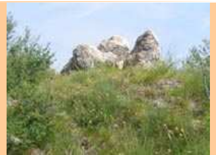
J'arrive à l'extrémité, vue sur le Mont Roulabre et ses fortifications. 16h00.