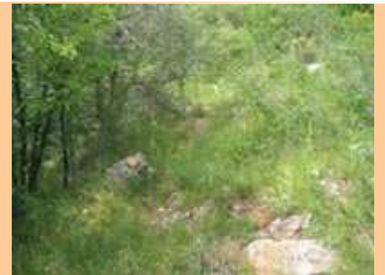
La pente s'accroît. La sente se faufile entre les rochers et la végétation toujours dense.