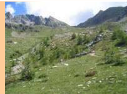
Vu sur le cirque du Mont neiglier et des Arêtes de la Pointe André. Une marmotte se laisse photographier. Le sentier s'élève en se dirigeant vers le verrou.