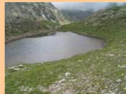
La pente se fait plus importante pour franchir le verrou. Le premier lac apparaît, le sentier le contourne.