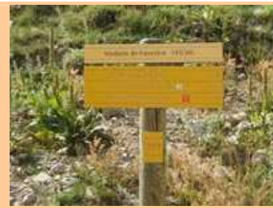
Les lacets dans les éboulis à descendre. La Vacherie, les bâtiments de la Madone. Balise 357, il est 16h15.