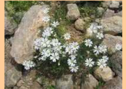
Les chevaux n'ont guère changé de place. L'herbe, envahie de fleurs, doit être tendre. Vue sur la crête le long de laquelle on descend. Des Céraistes des Champs.