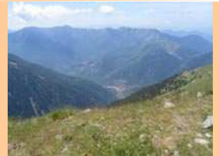
La Cougourde avec le Caïre des Gaisses surmonté de la Cime du Lombard au nord. Le Gélas au nord-est. Le cirque du Neigier au sud-est. St Martin Vésubie et les crêtes du Caïre Gros au Chalancha au sud-ouest.

Du sommet de la Cime de Piagu au Boréon par le même itinéraire qu'à l'aller.