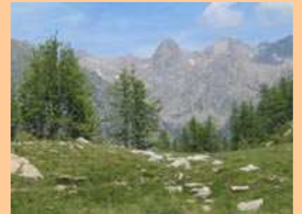
Une dernière photo sur la crête qui se prolonge au sud-ouest. Je rejoins Gene pour la pause repas. 13h50, nous reprenons le même chemin qu'à l'aller.