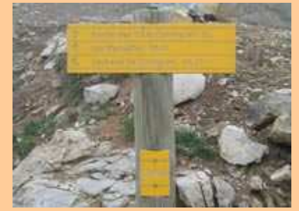
La Cime du Diable dans les nuages qui affleurent la crête. Je retrouve le chalet et la balise 244.